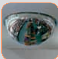
Oglinzi de supraveghe- re pag. 181