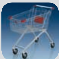
Cărucioare metalice pag. 178