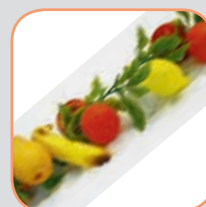
Figurine plastic pag. 182

Nu ne dăm seama de importanța lor decât atunci când lipsesc. Fie că vorbim de coșuri pentru cumpărături, cuttere profesionale sau oglinzi de supraveghere avem în fața noastră o categorie de produse de maximă utilitate. Mai mult decât atât, capitolul începe cu o selecție de cărucioare de cumpărături, o premieră pentru catalogul nostru.